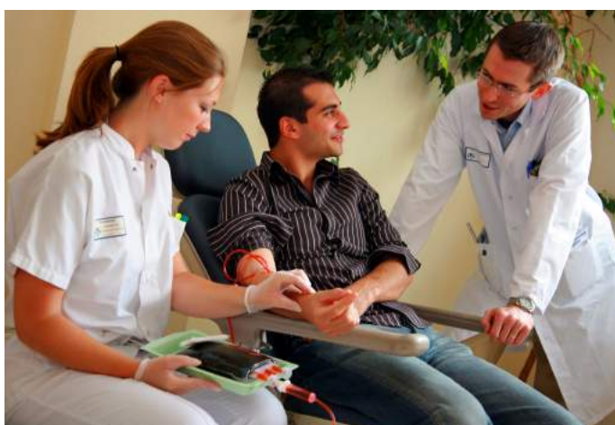
Réalisation d'une saignée